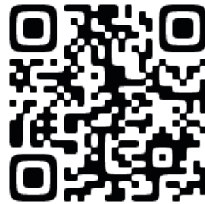
春闘要求アンケート

ソニーの中間決算は「巣ごもり需要」等で増収増益、営業利益5662億円は上半期で過去最大。積み上げた内部留保5兆2453億円も過去最高です。(下図)大幅賃上げ、雇用を守る体力は十分です。